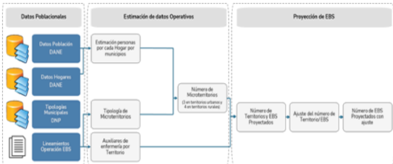
Figura 1. Esquema Proyecciones de EBS basados con base en Población DANE

Fuente: Elaboración propia del equipo de la Dirección de Promoción y Prevención.